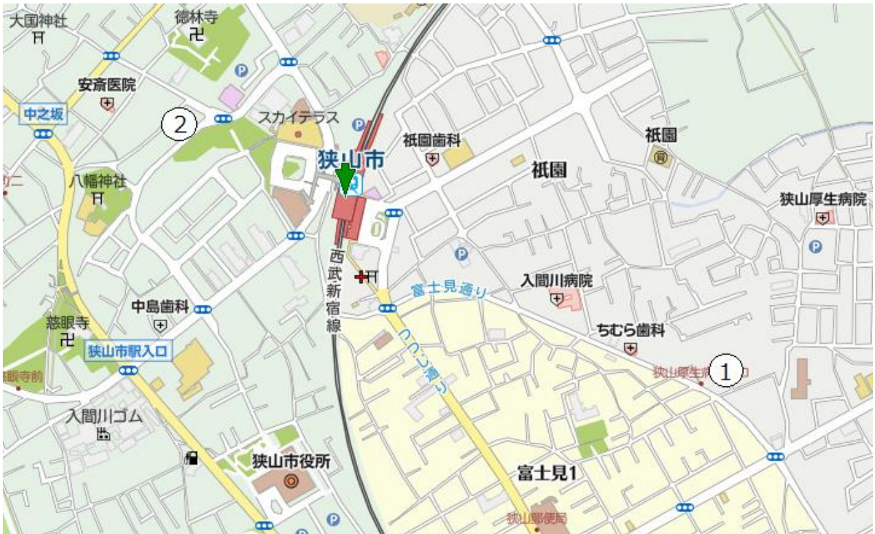
1 (仮称) 祇園風の会保育園