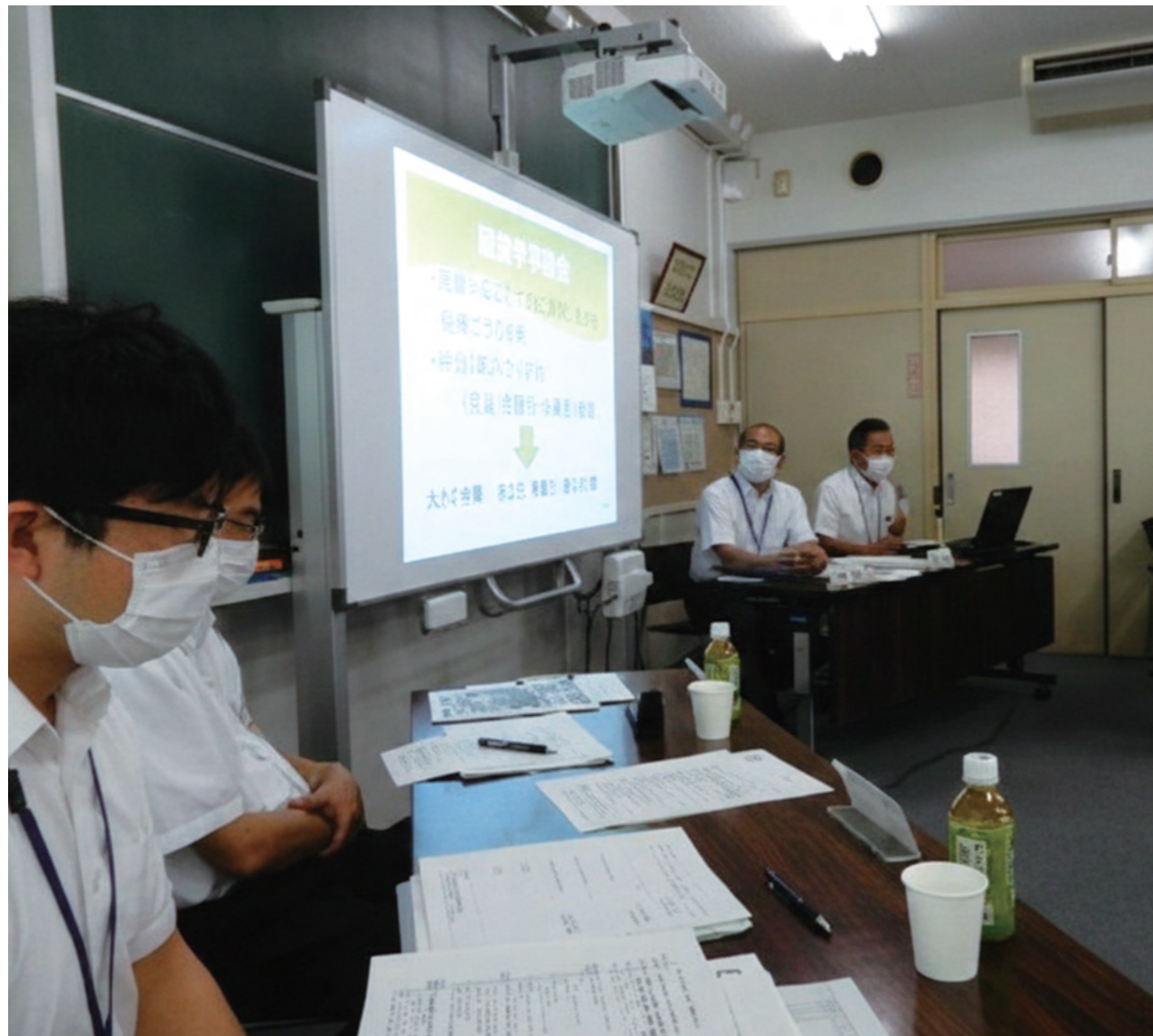
写真：コミュニティ・スクール