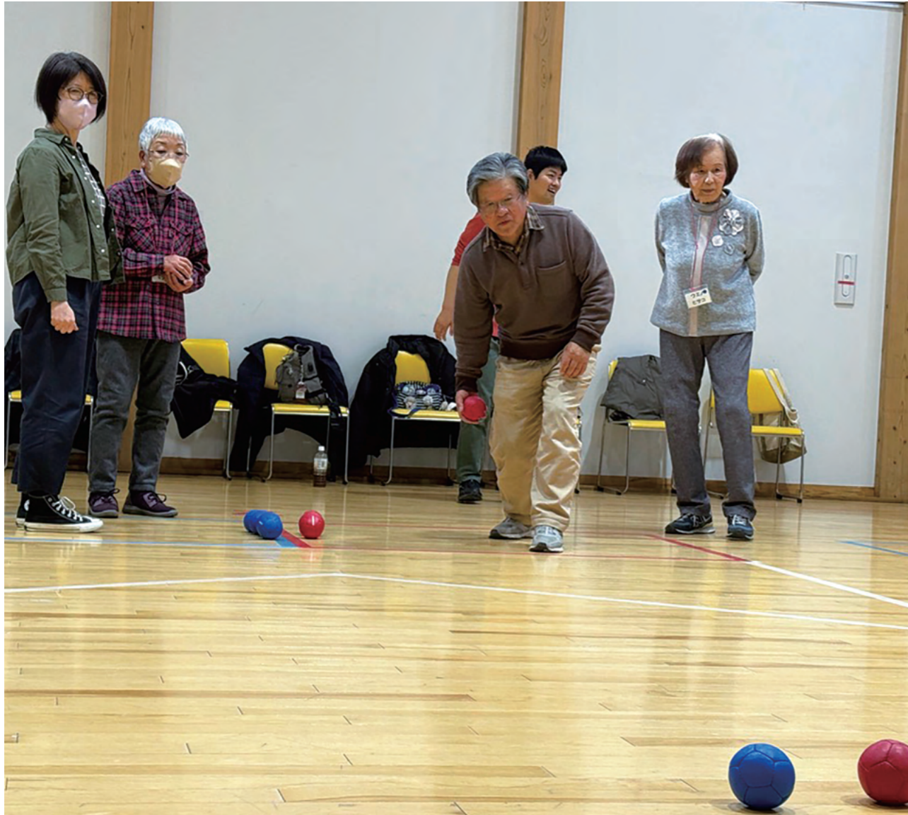
写真：ポッチャ大会