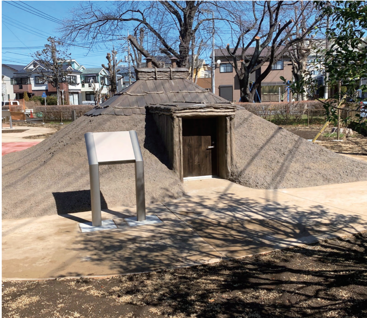
写真：市指定文化財「今宿遺跡」