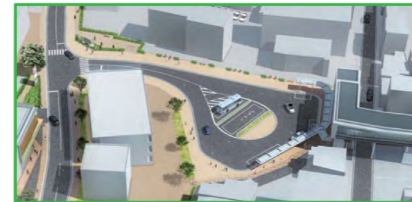
※画像はイメージであり、設計、施工により確定します。