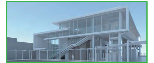
※画像はイメージであり、設計、施工により確定します。