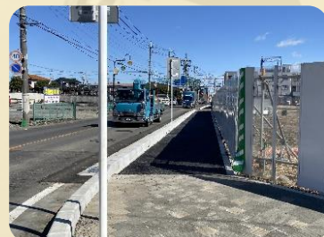
安全な歩道を整備しました