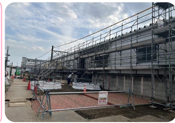
入曽駅の周りに足場を組んでいます