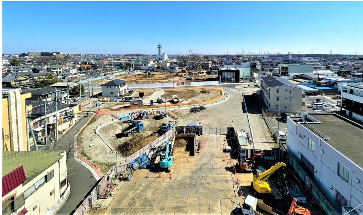
※エフズホール様にご協力をいただき、屋上より撮影