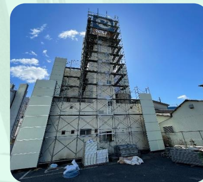
旧店舗解体のようす