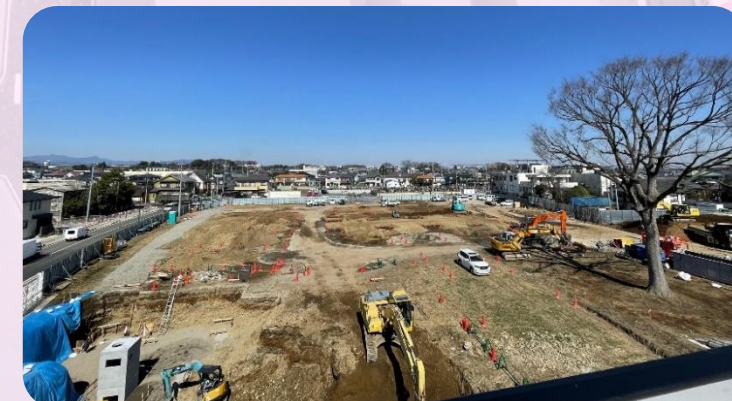
3月中旬の入間小学校跡地のようす