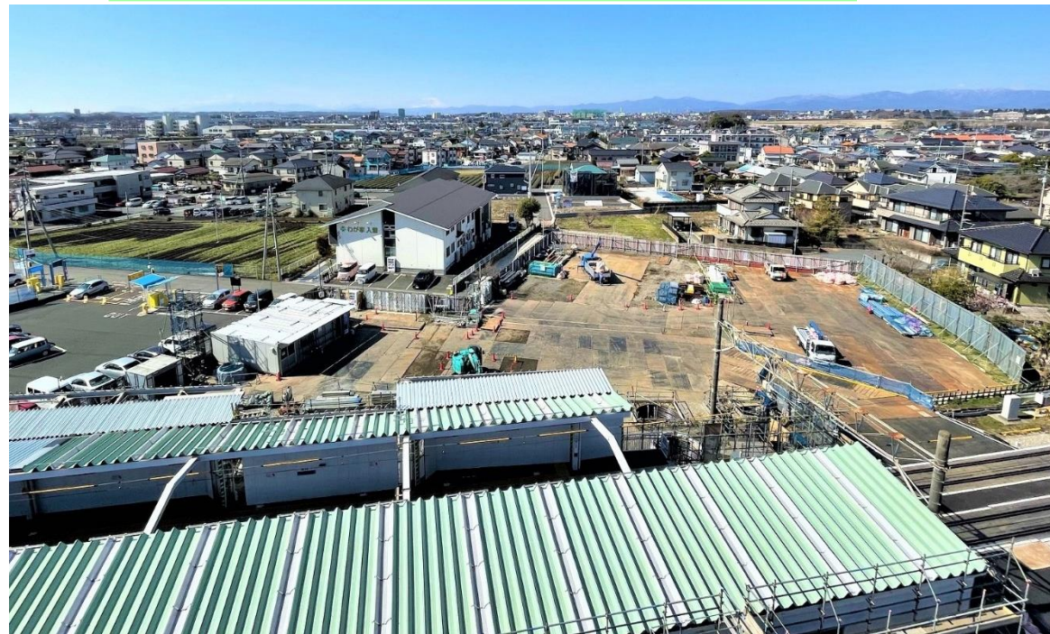
※エフズホール様にご協力をいただき、屋上より撮影