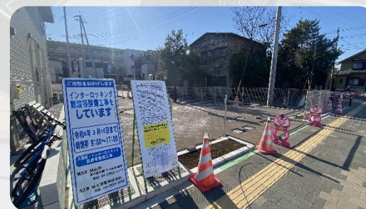
公園整備中のようす