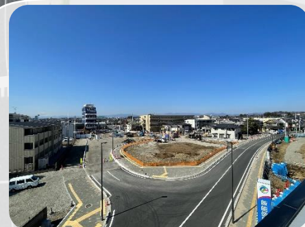
歩行者と車が分離され安全になりました

道路等築造工事（その4）につづきインターロッキング敷設等整備工事にて、公園の整備も進めています。