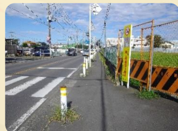
施工前の令和元年10月のようす

歩道の整備工事が実施されました。歩道が広がったことで整備前よりも安全性が高まり、入曽駅（新駅舎）方面への通行がより安全にできるようになりました。