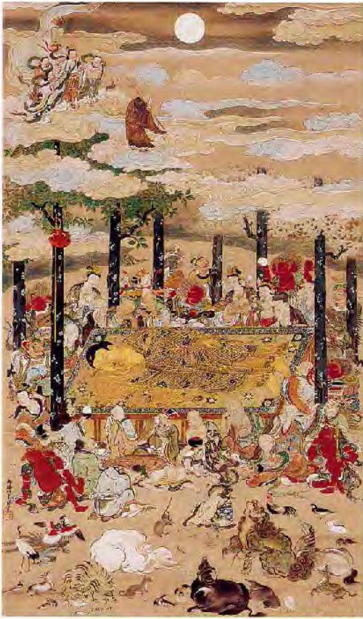
絹本着色釈迦涅槃図〔徳林寺〕