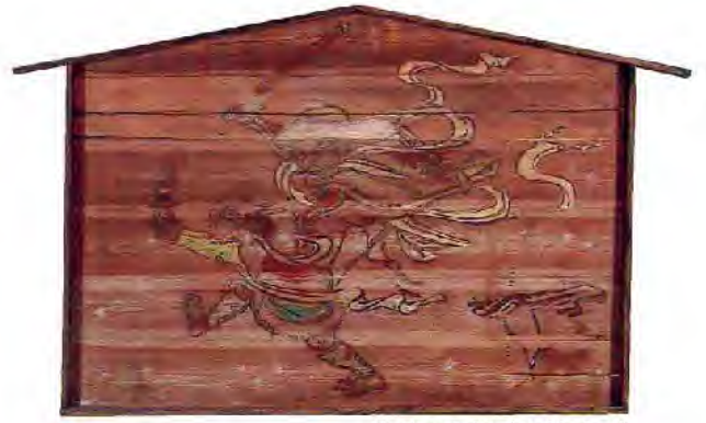
韋駄天の額〔白鬚神社〕