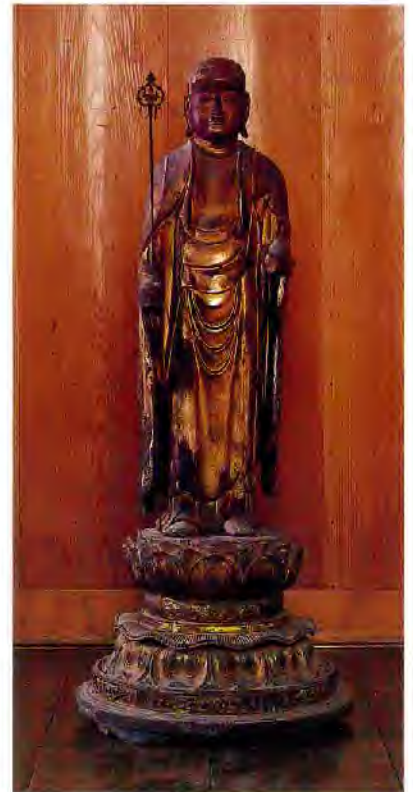
木造地藏菩薩立像〔金剛院〕