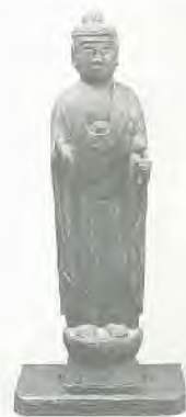
銅造聖観世音菩薩立像(円光寺)