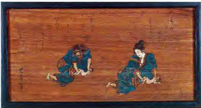
子返しの図〔白鬚神社〕