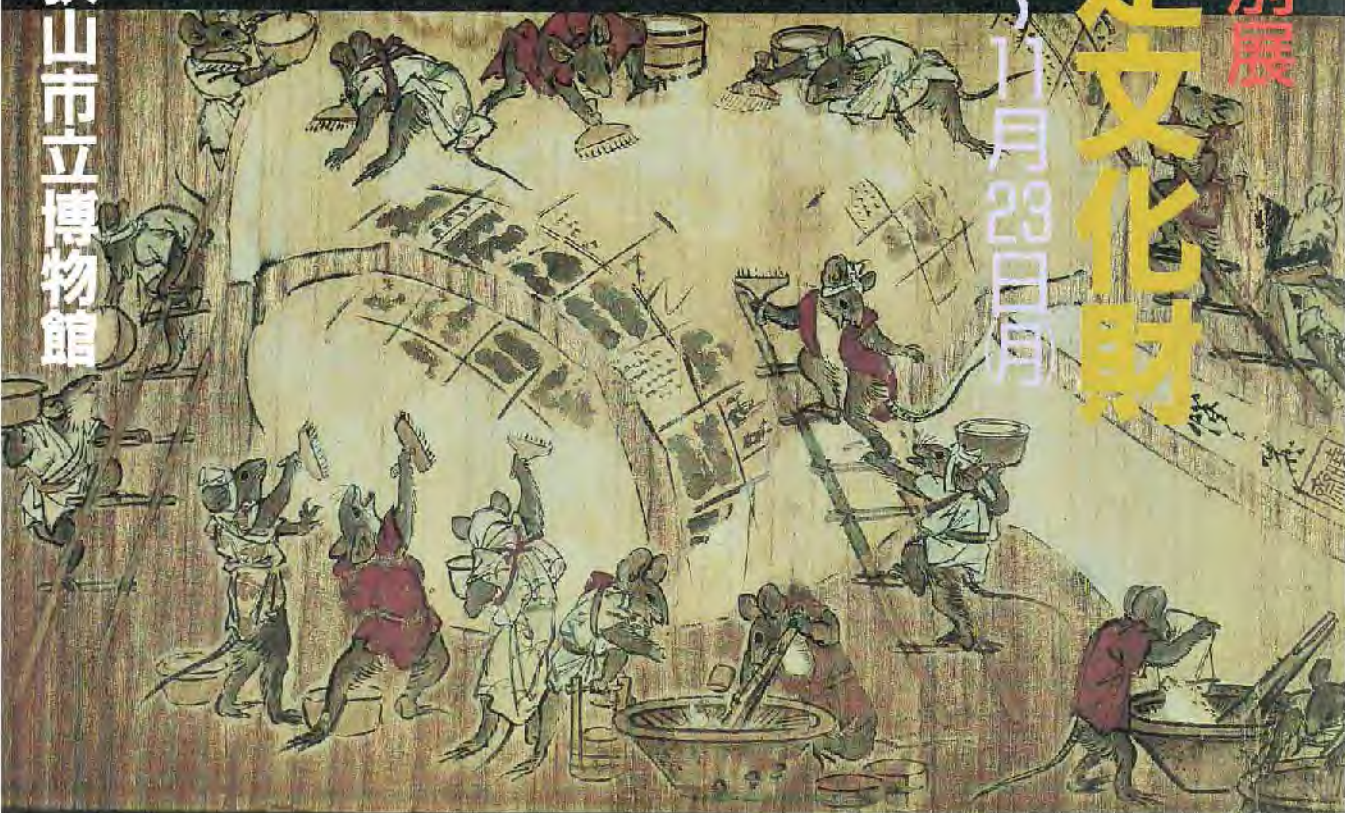
ねずみの図(西浄寺)