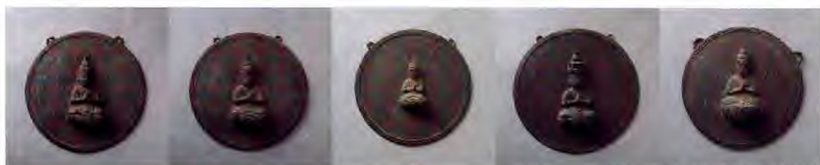
御正体（懸仏）〔白鬚神社〕

最後になりましたが、本特別展の開催にあたり、貴重な資料の出品を快くご承諾くださいました文化財所有者、管理者の方々に深く感謝申し上げます。