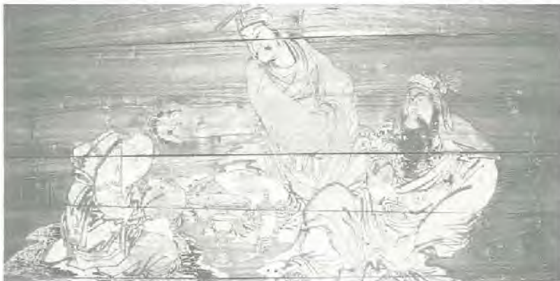
桃園三傑図(梅宮神社)

狭山市には埼玉県指定の文化財が7件、狭山市指定の文化財が41件あります。今回の特別展は、身近にありながら日頃接することの少ない文化財を一堂に集め、「建造物」「絵画」「彫刻」「工芸品」「書跡」「古文書」等の指定種別ごとに実物や写真/パネルで展示します。市内の文化財に接することで郷土狭山に一層親しみを感じていただくとともに、狭山の歴史への理解を深める助けともなれば幸いです。