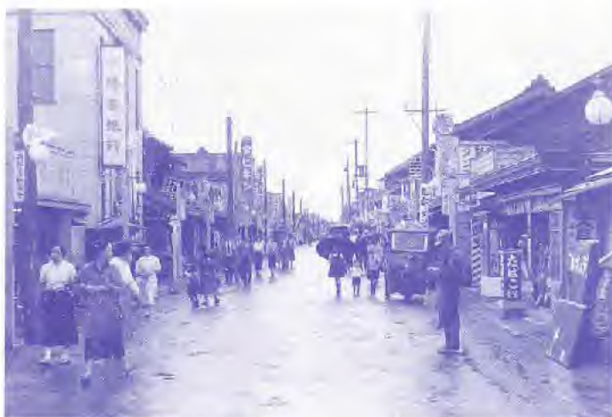
入間川3丁目交差点から東をみる。昭和29

●聴講希望の方は、9月15日祝から狹山市立博物館へ電話でお申し込みください。(定員50名)