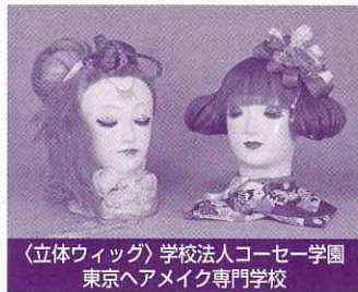
〈立体ウィッグ〉学校法人コーセー学園東京ヘアメイク専門学校

さらに、女性が明るく生きることをサポートするために優しい工夫のこらされた「介護服」は、私たちに、服飾の新たな可能性を提示しています。ぜひ、直接触れながらご覧ください。