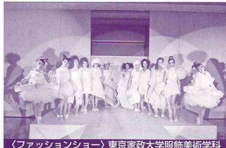
〈ファッションショー〉東京家政大学服飾美術学科