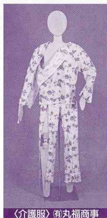
〈介護服〉(有)丸福商事