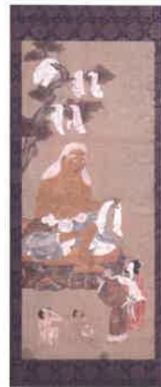
江戸時代 明光寺所蔵