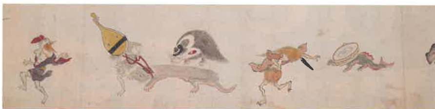
「百鬼夜行絵巻」江戸時代 学習院大学史料館所蔵

この夏、狭山の地にて妖怪の世界をお楽しみください。 ※会期中、展示替えがあります。