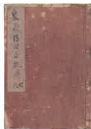
『泉州信田白狐伝』江戸時代

チラシ表面掲載資料：藤ノ舘口(梅宮神社所蔵資料複製)／栗原羅羅「鬼と録箱」／「百鬼夜行絵巻」部分(学習院大学史料館所蔵) ※特に記載のない資料は当館所蔵