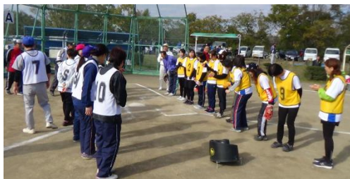
トスペースは当日会場に参加を呼びかけ混合チームを編成、管ごと和気あいあい、楽しくゲームを行いました