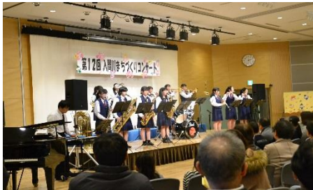
高校生のパワーあふれる吹奏楽口