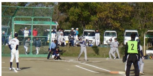
どの試合も、接戦、熱戦！「がんばって！」(けがしないよね?)と声援を送る家族の方も大勢来場されました

引締まった冬空のもと、上級と初級の2つの部門に23チームが参加し、熱戦が繰り広げられました！トスペースボール部門では菅原二丁目自治会VS「当日編成チーム」の体験試合を行い結果は引分け。若者も先輩方も、敵も味方も、ともに白球を追い、地域の交流も一層深まった一日でした。早朝から運営にあたった実行委員と狭山市ソフトボール協会審判団の皆さん、ありがとうございました。