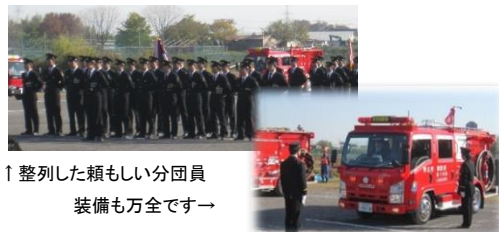
↑整列した頼もしい分団員 装備も万全ですー

12/1(土)年末恒例の狭山市消防団特別点検が柏原河川敷公園で行われました。特別点検は、不測の災害に即時対応できるよう、装備を万全に備え、心身の鍛錬につとめるものです。入間川地区の安全・安心な暮らしを、消防団第1分団・第2分団はこれからも守っていきます！