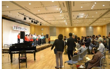
会場の皆さんと大合唱～♪また来年も!