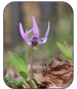
※写真は過去のものになります