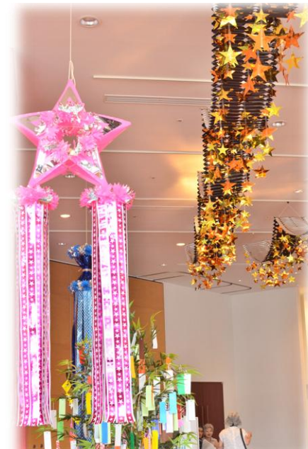
市民交流センター内の飾り

8月2日(土)、第2回の教室では、七夕飾りの撮影に挑戦。参加者はお気に入りの飾りを見つけてスカイテラスのデッキや商店街へ