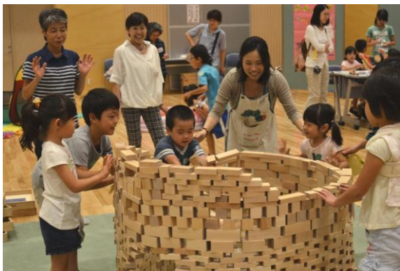
協力して慎重に積み上げた大きな積み木を最後は勢いよくでみんなで崩しました

私たちは、子育ての不安や悩みを抱えている人たちに、アドバイスや相談などの支援をしながら、公民館や学校、幼稚園で「親の学習」の講座や講演もしています。活動を通じて、家庭や地域とのつながりを密にしながら、家庭教育アドバイザーの活動を広げていきたいです。