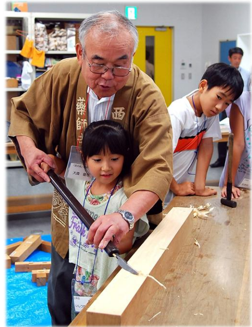
「後ろ歩きしながら削るので、ダンスしているようでおもしろかった」

最終日には、体験した出来事を「伝える」ために、参加した子供たちや保護者、講師らを前に発表を行いました。