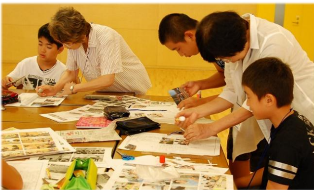
第二段階の新聞づくりを教わっている様子