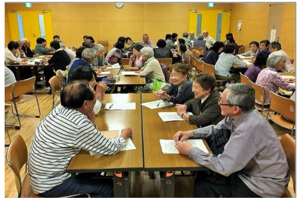
防災対策について意見交換する受講生

災害が起きるたびに防災対策を考えますが、のど元過ぎればで、つい忘れてしまいがちです。被災者の方々の心痛をおもんぱかると同時に、防災の企画などを通じて皆さんと一緒に、いざという時にどのように行動したらよいのか考えていきたいと思えます。