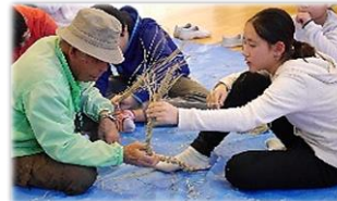
受け継がれる技 (奥富小)

【開催日時】 2月22日(木) から26日(月) 9:00～19:00 (最終日は16時まで) 【場 所】 市民交流センター コミュニティホール 【問合せ】 中央公民館へ ☎2952-2230