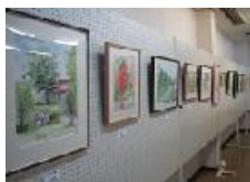
狭山水彩画同好会