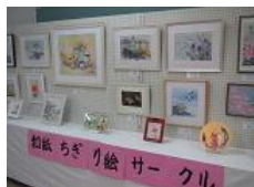
和紙ちぎり絵サークル