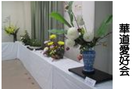
華道同好会すずらん