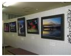
入間野写真クラブ