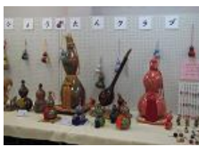
狭山ひょうたんクラブ