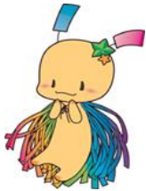
狭山市七夕の妖精 おりびい

発行日：令和3年4月9日（金） 発行：狭山市立富士見集会所 〒350-1306 狭山市富士見1-1-18 TEL&FAX：04-2959-6230 E-Mail： fujimi-s@city.sayama.saitama.jp