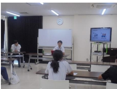
【お金について考えてみよう】