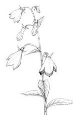
ヒメシャジン 絵 山本悦子

私たちの先を行くペアに出会ったことはなかったので、恐らく完登順位は1桁だったのではなかろうか。(続く)