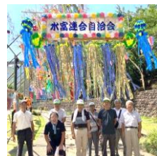
▲自治会のやらい飾り