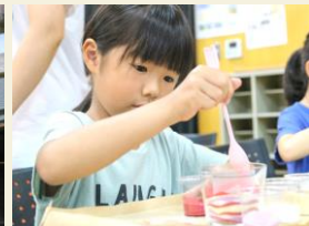
8月9日カラーサンドアート体験