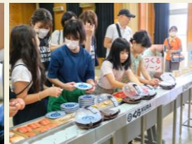
8月17日お寿司で学ぶSDGs