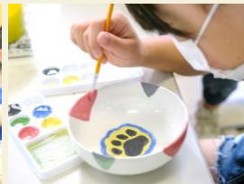
8月10日オリジナルプレート絵付け