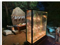
▲ 投稿者:ハタさんさん