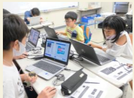
8月2・4日プログラミング体験