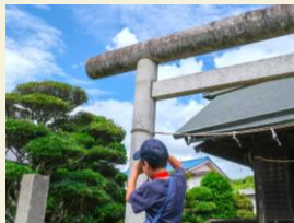
8月7日小学生向け写真教室