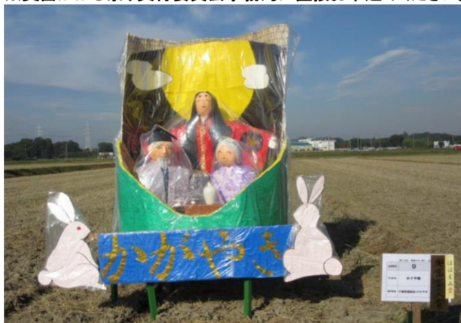
第28回(前回)奥富かかし祭り大賞受賞作品