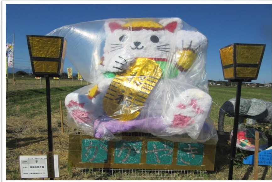
第29回(前回)奥富かかし祭り大賞受賞作品「幸福の招き猫」 介護保健施設 かがやき

【開催期間・会場】 10月29日(日)～11月5日(日) の午前中 奥富小学校南側田んぼ沿い(通称フラワーロード)