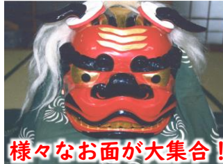
様々なお面が大集合！