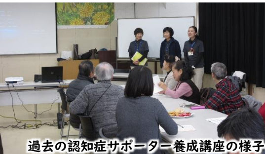
過去の認知症サポーター養成講座の様子

※参加したい回だけに参加することもできます 次回以降の内容は公民館だよりでご案内します (各回申し込みが必要です)