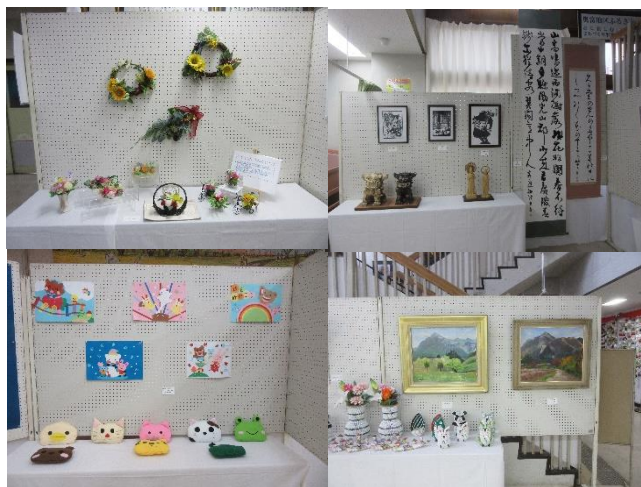
※昨年の個人作品の例です