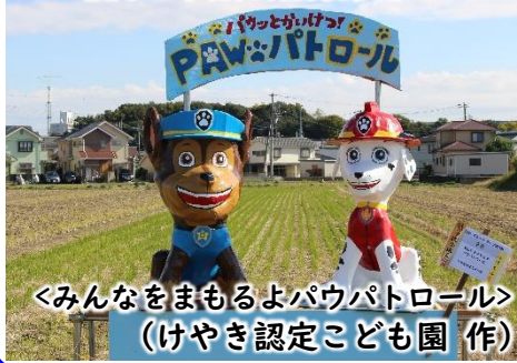
<みんなをまもるよパウパトロール> (けやき認定こども園 作)