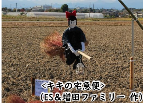
<キキの宅急便> (ES&増田ファミリー 作)