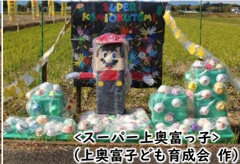
<スーパー上奥富っ子> (上奥富子ども育成会 作)