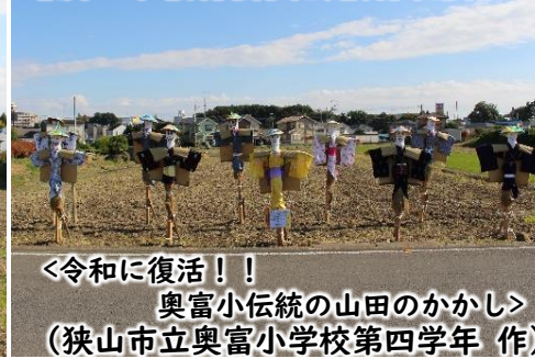
<令和に復活!!> 奥富小伝統の山田のかかし (狭山市立奥富小学校第四学年 作)