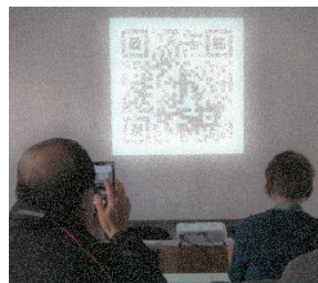
二次元コードの読み取り