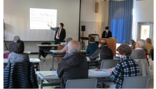
スマホ講座中級編の様子

★各携帯電話会社でスマホ教室を開催しているので、不明な点の解消にはこれら教室に参加することも、ひとつだと思いました。