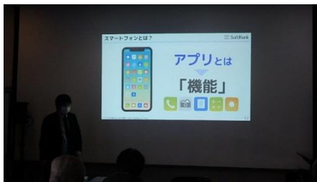
スマホの基礎知識を説明する スマホアドバイザー