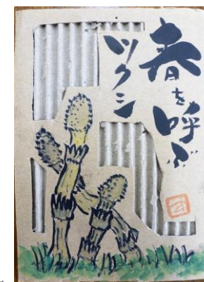
段ボールを使った作 品。自由な表現方法が 楽しめます。

【活動日時】第1・4月曜 午後1~4時 【会 員 数】12名 男女比 1:3 【年 齢 層】60歳代中心 【会 費】月額1,000円 入会金1,000円 【連 絡 先】和光さんへ Tel: 04-2957-4718