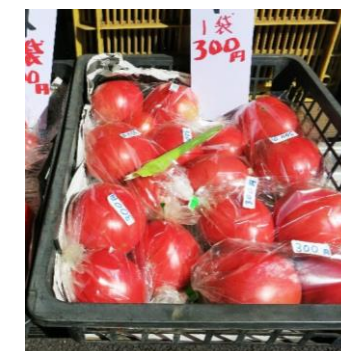
美味しそうな地場の野菜が並びます。