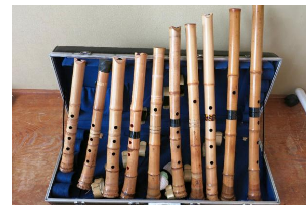
すばらしい尺八セット

お隣の寺田会長に聞きました。「調子(キー)を表す数字で尺八の長さを示します。2上がりは三味線の2番目の絃を上げます」。尺八は1尺3寸から2尺3寸迄あり、長くなるほど低い音が出る。会員の方が持っていた10本セットの値段が時価500万円位と言われてびっくり。86歳の方の朗々とした唄にまたびっくりボン。▼会員の若松さんは「民謡を歌っていると風邪をひかないよ」。腹式呼吸で大きな声を出し、歌詞を覚えて脳を活性化！確かにこれで元気にならない訳がないと納得。(阿部記者)