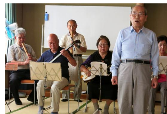
全員での演奏は壮観です(公民館和室にて)