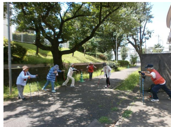
ウォーキング前の準備体操