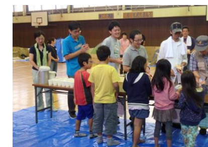
非常食の配給を順番に待ちます♪

元気プラザの体育館で段ボールの家作り。段ボールの上で一晩寝る体験は、防災知識としてとても貴重でした。