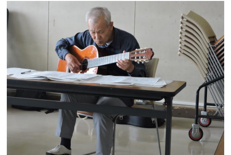
パート楽譜に集中

弾き終わるとあちこちからため息が漏れました。「テンポが早すぎる」「平板だね、波がないと・・・」「メリハリがほしいね」「もっとリズムを合わせて」などの声。合奏は、自分のパートだけでなく隣の人の音、全体のリズムを捉えて集中しなければ音曲としての統一性はとれない。リーダーの譜面のパートについて留意点が指摘されると、皆はそれを譜面にメモをする。「集中して合わせよう、もう一度！」弾く指に力がこもって雰囲気は熱くなってきました。