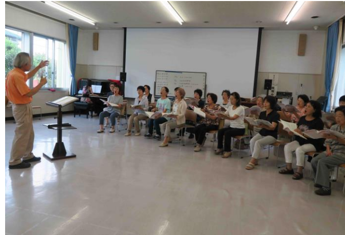
息をぴったり合わせて♪