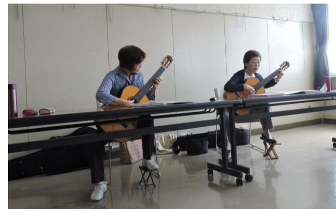
リズムとメロディーを合わせて

年間の演奏会は「公民館文化祭」と「ふれあい音楽祭」(狭山元気プラザ)など、また出前の依頼にも応じているそうです。葛西記者