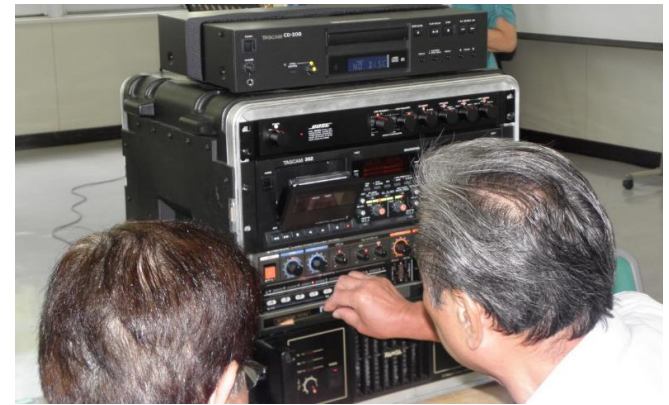
カラオケ操作盤の操作光景