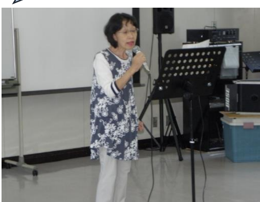
譜面台の歌詞を見て歌う光景