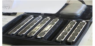
ハーモニカセット