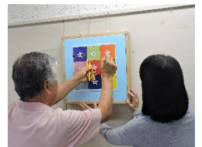
点数確認は二人で