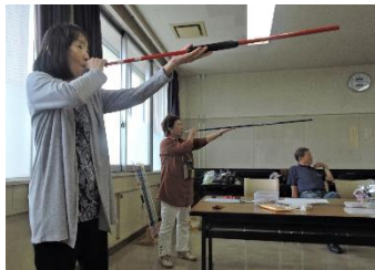
ゆったり、腹式呼吸で

6月21日(木)午後「さやま吹き矢クラブ」取材しました▼当クラブは「さやま市民大学同窓会」の会員を中心に設立され、現在、会員は23名(毎週木曜日13時30分~17時)、同窓会員や地域にかかわらず広く会員を募っています▼社会福祉協議会からはいくつかの特別養護施設などへのボランティア活動の協力を求められ、出向いて、吹き矢が年齢や体力、身体状況に関係なく健康リクレーションとして誰でも気軽に参加出来る競技であることを実践披露、PRに努めています▼前半競技のあと、ティータイムを挟んで後半はピンゴ的を使っての競技です。的までの距離は7m、床からの中心まで1.6m。ルールにしたがって点数を競い合います▼矢は1回9本。足の位置を整え、筒(1m)に矢を込めてゆっくり息を吸いつつ両手で掲げ、ゆっくり息を吐きながら下ろす。的を定め、息を吸いつつ筒を口へ、一気に吐く。