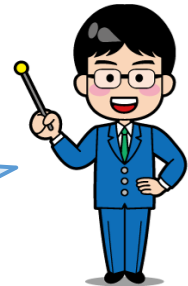
財政課のお兄さん

おりひい、たとえば、多くのお友達が通っている 狭山市立の保育所、小学校や中学校はだれが 管理していると思う？