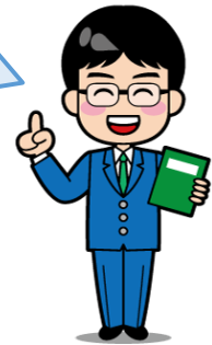
財政課のお兄さん

その通り！狭山市が管理運営をしているんだよ。 それから、みんなが通る道路(市道)をつくったり、おうちからでるごみの収集をしたり、それらを見~んな狭山市が整備したり、管理をしているんだ！ 他にも、みんなの健康を守るための健康診断や、病気を予防するための予防接種も行っているんだ！